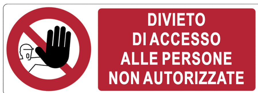
CARTELLO DIVIETO DI ACCESSO