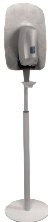
Piantana da terra e salvagocia incluso