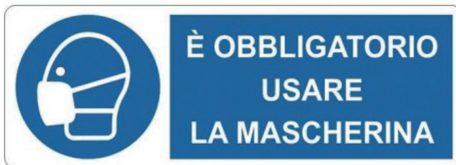
CARTELLO OBBLIGO MASCHERINA